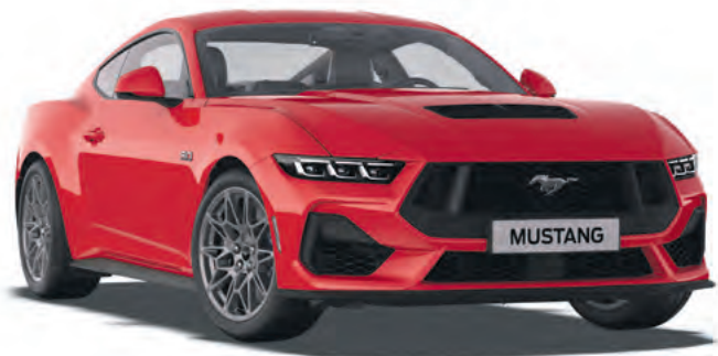
RACE RED - LAKIER ZWYKŁY 2 600,-