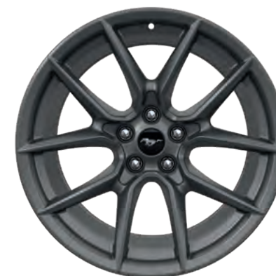
19" OBRĘCZE KÓŁ ZE STOPÓW LEKKICH STANDARD W WERSJI DARK HORSE™