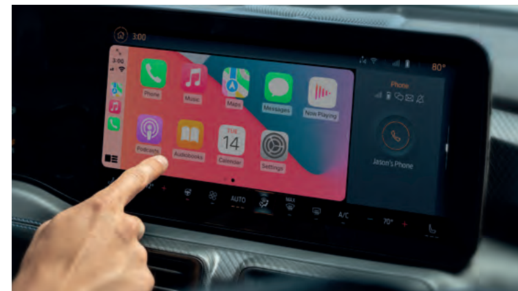
BEZPRZEWODOWA OBSŁUGA APPLE CARPLAY I ANDROID AUTO Standard dla wszystkich wersji