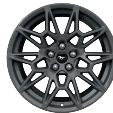
19" OBRĘCZE KÓŁ ZE STOPÓW LEKKICH STANDARD W WERSJI GT