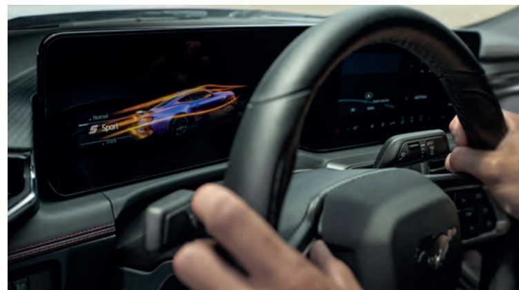
DRIVE MODE - SYSTEM WYBORU TRYBU JAZDY