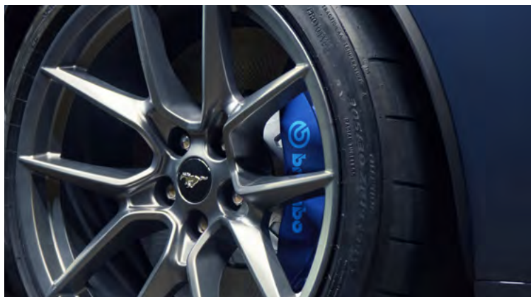
ZACISKI HAMULCOWE LAKIEROWANE NA NIEBIESKO, Z NIEBIESKIM LOGOTYPEM BREMBO™ Opcja dostępna tylko dla wersji DARK HORSE™ w pakiecie DARK HORSE™