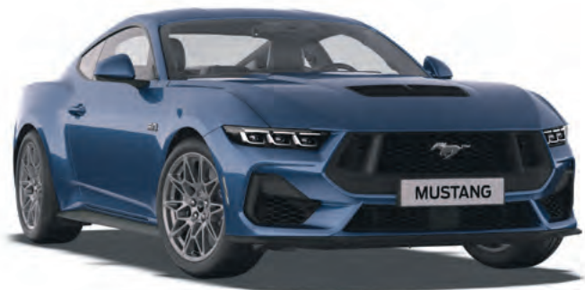
ATLAS BLUE - LAKIER METALIZOWANY 4 300,-