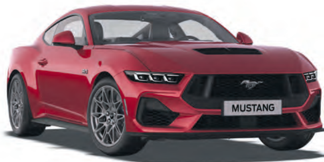
LUCID RED - LAKIER METALIZOWANY SPECJALNY 6 200,- | LAKIER NIEDOSTĘPNY DLA WERSJI DARK HORSE™