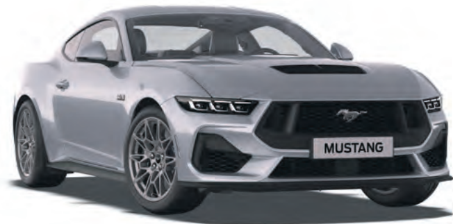
ICONIC SILVER - LAKIER METALIZOWANY 4 300,- | LAKIER NIEDOSTĘPNY DLA WERSJI DARK HORSE™