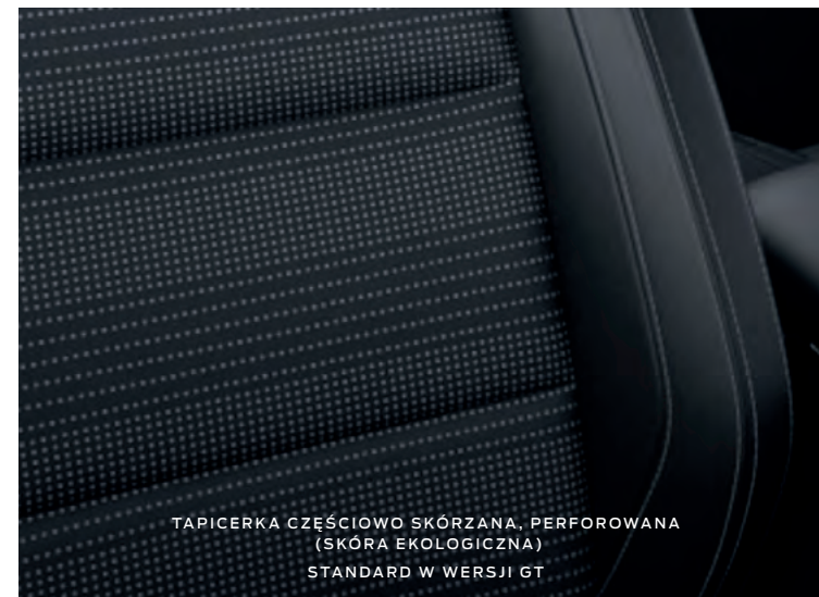
TAPICERKA CZĘŚCIOWO SKÓRZANA, PERFOROWANA (SKÓRA EKOLOGICZNA) STANDARD W WERSJI GT

(ilustracje mogą nieznacznie różnić się od wersji produkcyjnej)