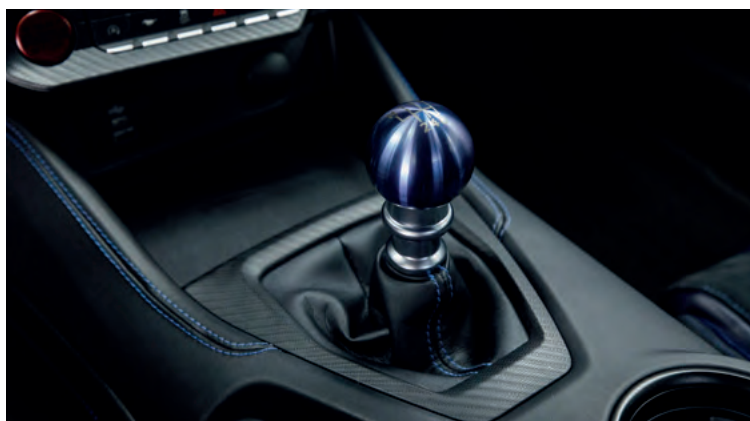
SPORTOWA, MANUALNA SKRZYŃNIA BIEGÓW TREMEC 3160 Standard dla wersji DARK HORSE™