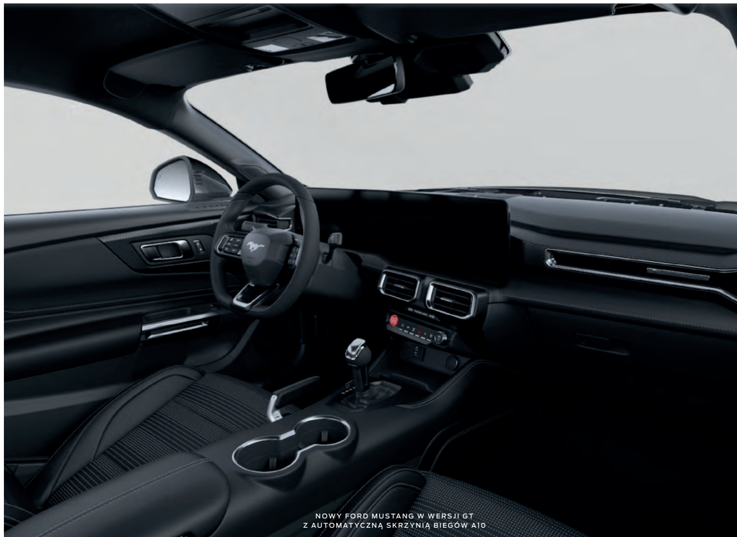
NOWY FORD MUSTANG W WERSJI GT Z AUTOMATYCZNĄ SKRZYNIĄ BIEGÓW A10

(ilustracje mogą nieznacznie różnić się od wersji produkcyjnej)