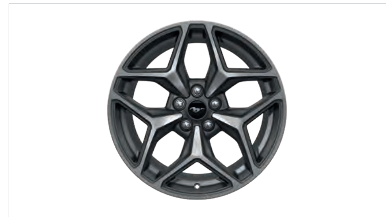
19" KUTE OBRĘCZE KÓŁ ZE STOPÓW LEKKICH