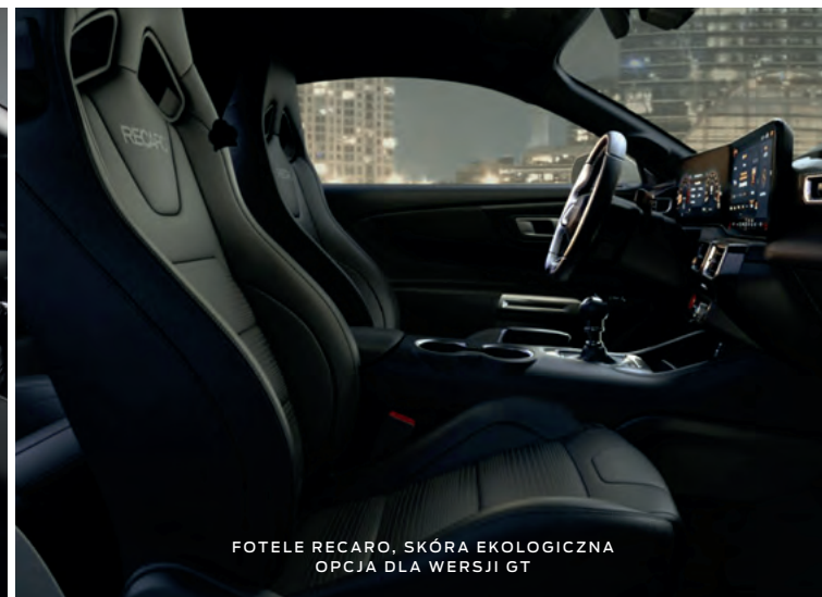
FOTELE RECARO, SKÓRA EKOLOGICZNA OPCJA DLA WERSJI GT