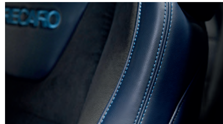
FOTELE RECARO Z TAPICERKĄ CZĘŚCIOWO SKÓRZANĄ W KOLORZE INDIGO BLUE

8 500,- dla wersji Dark Horse z pakietem Dark Horse