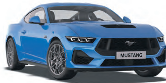
GRABBER BLUE - LAKIER METALIZOWANY SPECJALNY 6 200,-