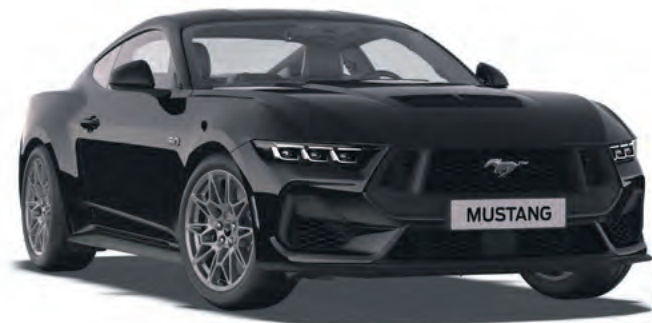
ABSOLUTE BLACK - LAKIER SPECJALNY 4 300,-