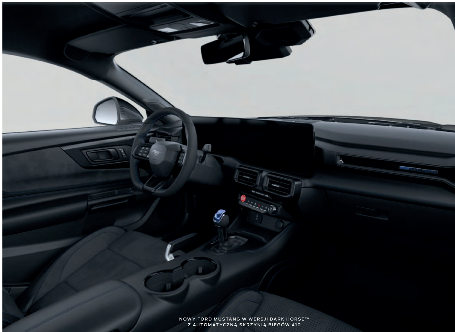
NOWY FORD MUSTANG W WERSJI DARK HORSE™ Z AUTOMATYCZNĄ SKRZYNIĄ BIEGÓW A10

(ilustracje mogą nieznacznie różnić się od wersji produkcyjnej)