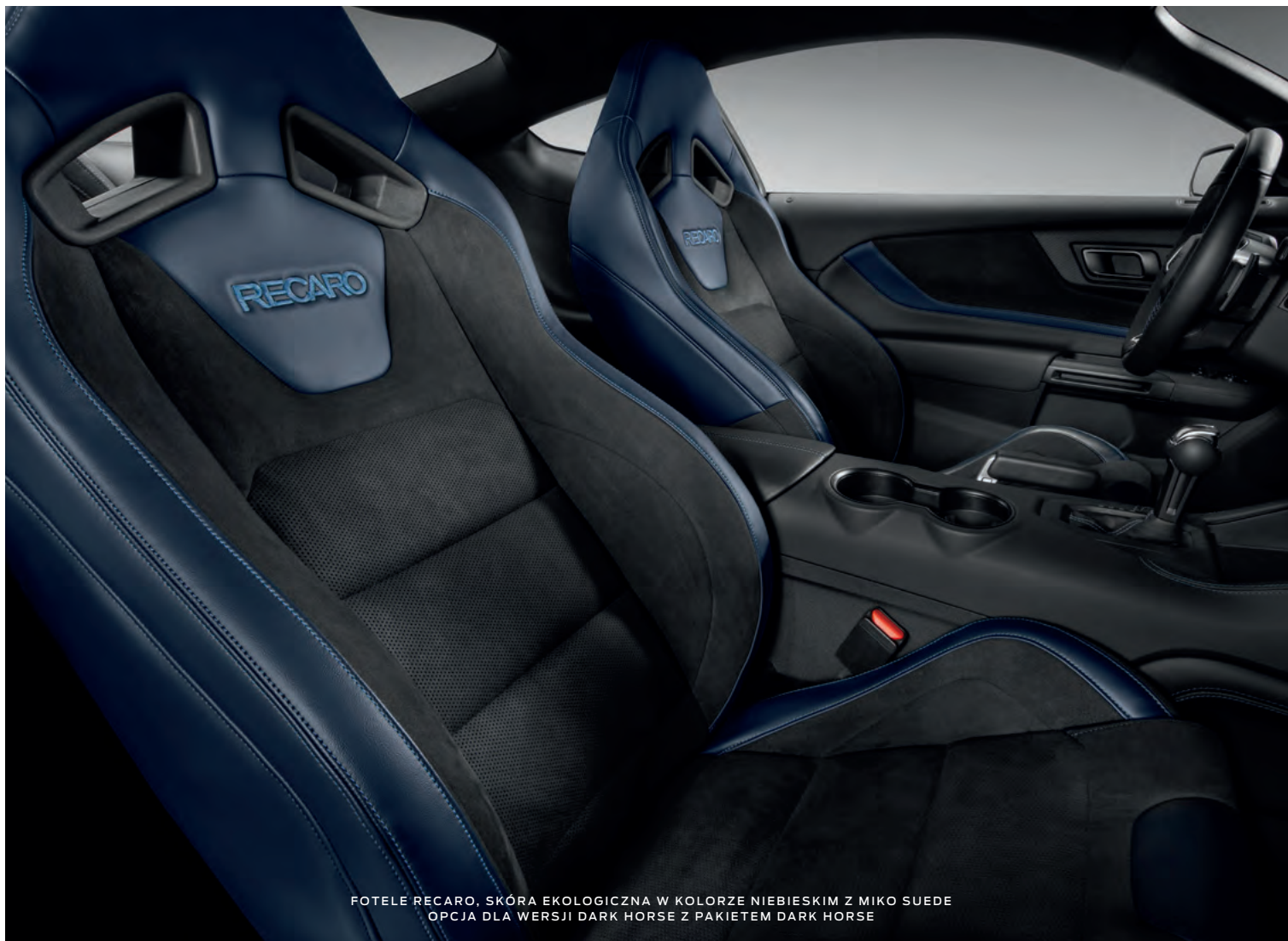
FOTELE RECARO, SKÓRA EKOLOGICZNA W KOLORZE NIEBIESKIM Z MIKO SUEDE OPCJA DLA WERSJI DARK HORSE Z PAKIETEM DARK HORSE