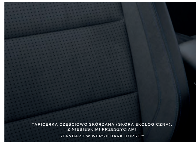
TAPICERKA CZĘŚCIOWO SKÓRZANA (SKÓRA EKOLOGICZNA), Z NIEBIESKIMI PRZESZYCIAMI STANDARD W WERSJI DARK HORSE™