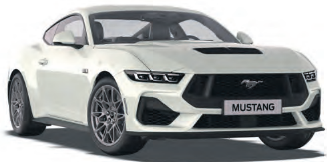
OXFORD WHITE - LAKIER ZWYKŁY BEZ DOPLATY