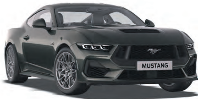
DARK MATTER GREY - LAKIER METALIZOWANY 4 300,-