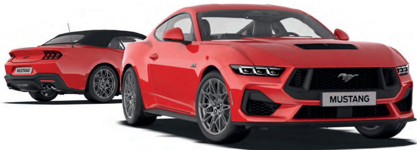
NOWY FORD MUSTANG W WERSJI GT NADWOZIE: CONVERTIBLE (PO LEWEJ STRONIE), FASTBACK (PO PRAWEJ STRONIE) Z LAKIEREM ZWYKŁYM RACE RED (OPCJA)

(ilustracje mogą nieznacznie różnić się od wersji produkcyjnej)