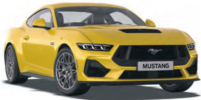
YELLOW SPLASH - LAKIER METALIZOWANY 4 300,- | LAKIER NIEDOSTĘPNY DLA WERSJI DARK HORSE™