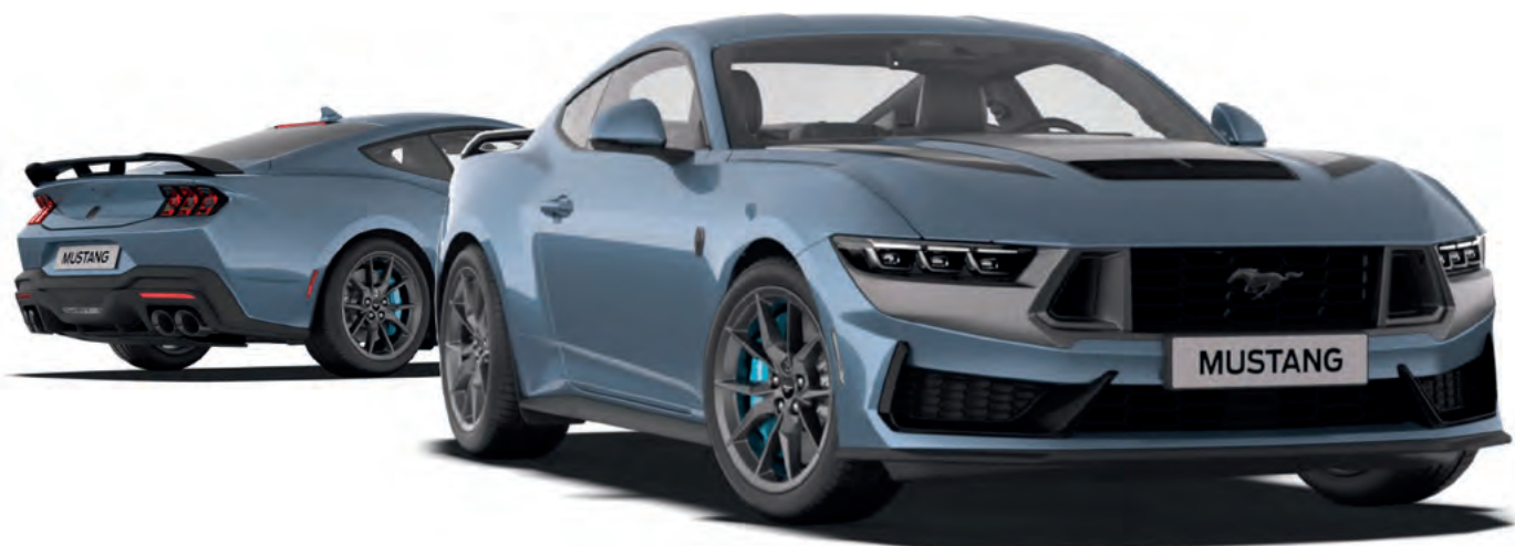
NOWY FORD MUSTANG W WERSJI DARK HORSE™ NADWOZIE FASTBACK Z LAKIEREM METALIZOWANYM VAPOUR BLUE (OPCJA)