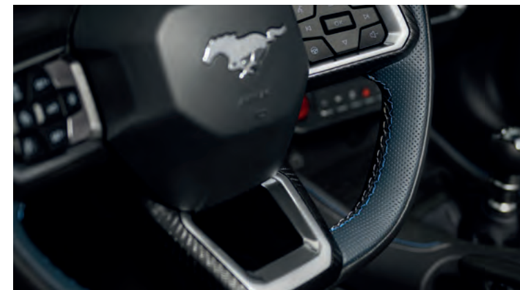
SPLASZONA U DOŁU, PODGRZEWANA KIEROWNICA Standard dla wszystkich wersji Dla wersji Dark Horse oraz w pakiecie California Special - z niebieskimi przeszyciami