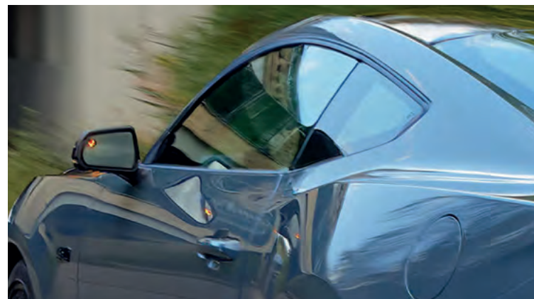
BLIND SPOT ASSIST Z CROSS TRAFFIC ALERT (CTA) - SYSTEM MONITOROWANIA MARTWEGO POLA WIDZENIA W LUSTERKACH