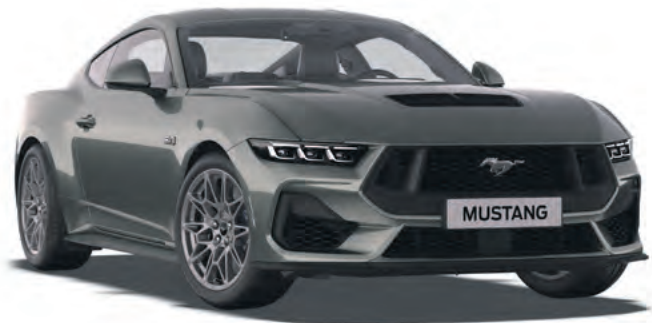
CARBONIZED GREY - LAKIER METALIZOWANY 4 300,-